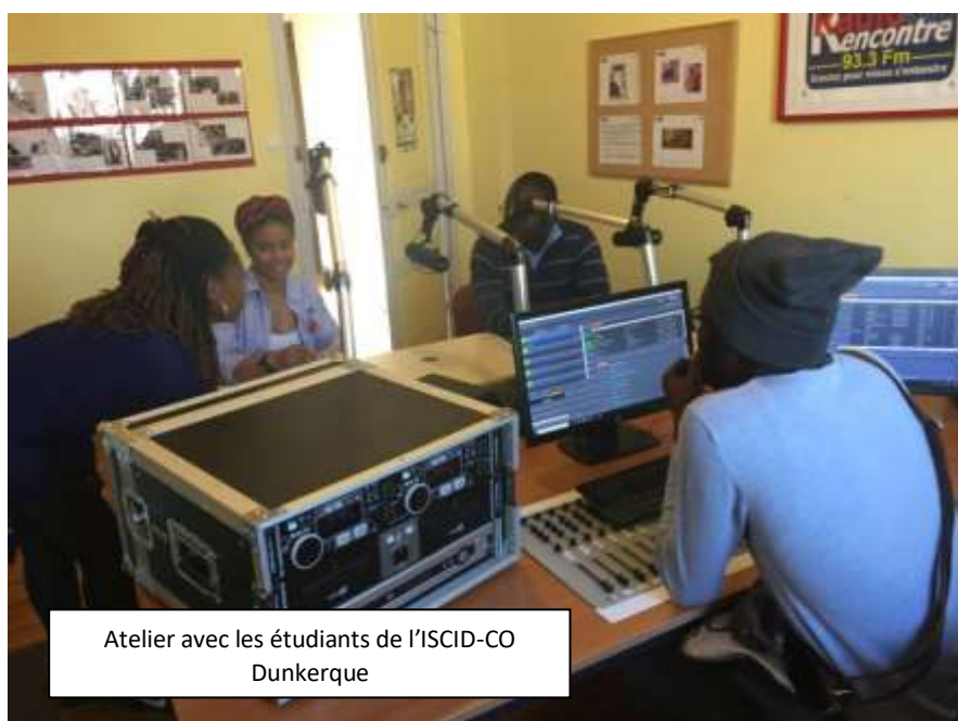
Atelier avec les étudiants de l'ISCID-CO Dunkerque