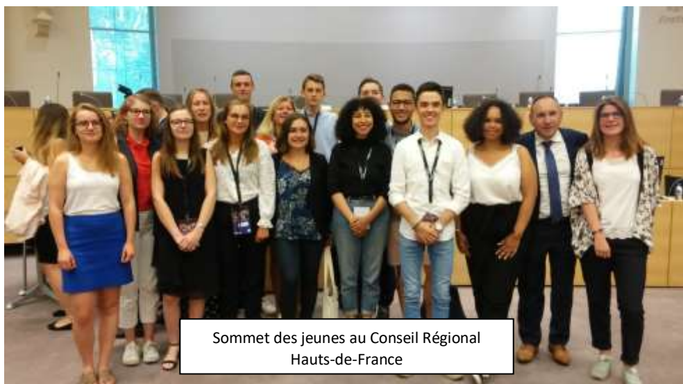
Sommet des jeunes au Conseil Régional Hauts-de-France