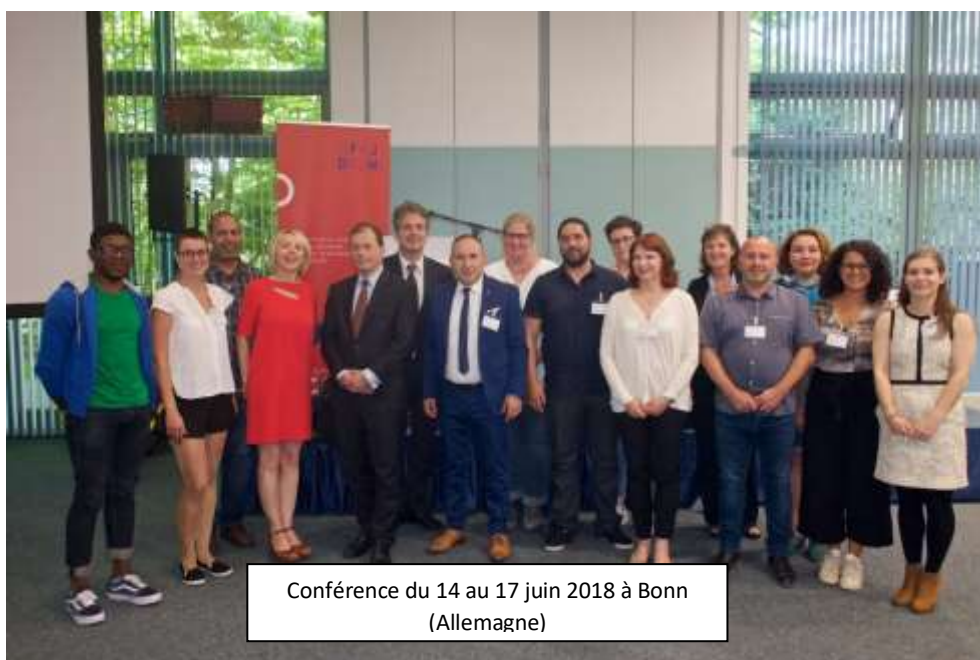
Conférence du 14 au 17 juin 2018 à Bonn (Allemagne)

Depuis sa création en 2015, le Cefir est un membre actif du réseau franco-allemand « Route NN » qui vise à favoriser les échanges entre les jeunes des régions Hauts-de-France et Rhénanie du Nord Westphalie. Du 14 au 17 juin 2018, la troisième conférence pour les acteurs de jeunesse des deux régions intéressées par les échanges franco-allemands, a été organisée à Bonn. Le Cefir a participé activement à l'organisation et l'animation de cette conférence. Le réseau compte actuellement 6 membres.