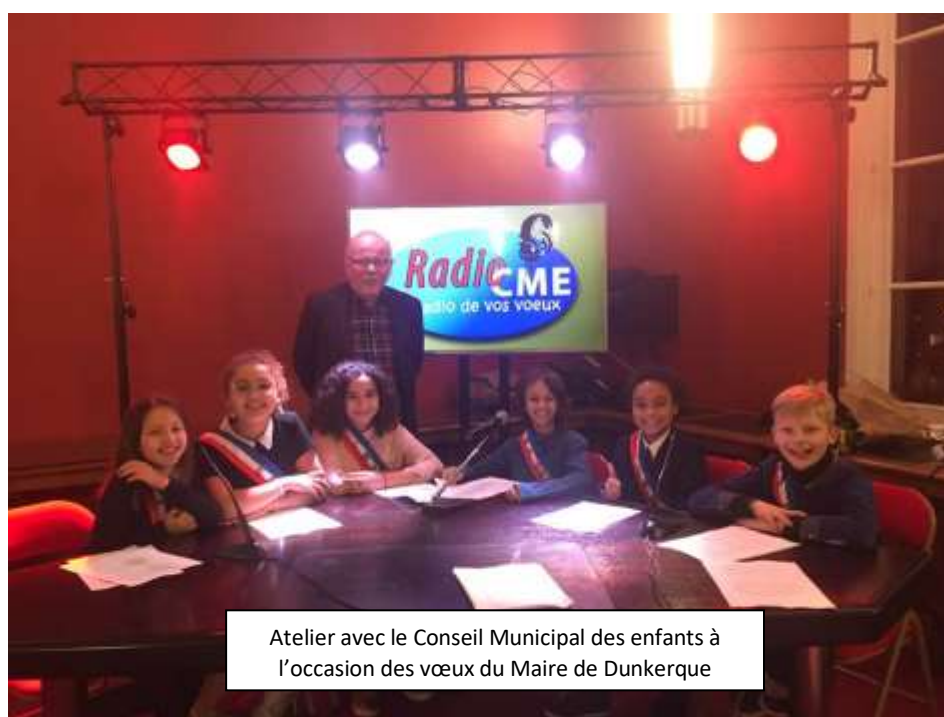
Atelier avec le Conseil Municipal des enfants à l'occasion des vœux du Maire de Dunkerque

13 ateliers radiophoniques 113 participants 234 H de formation (soit 26 442 H/stagiaire) 67 productions propres diffusées par la FRANF 14 invités de « Paroles d'Assos » 18,5 H/jour d'émissions produites 48,5 H/semaine de programmes d'intérêt local Diffusion 24 h/24, 7 j/7 20 animateurs bénévoles