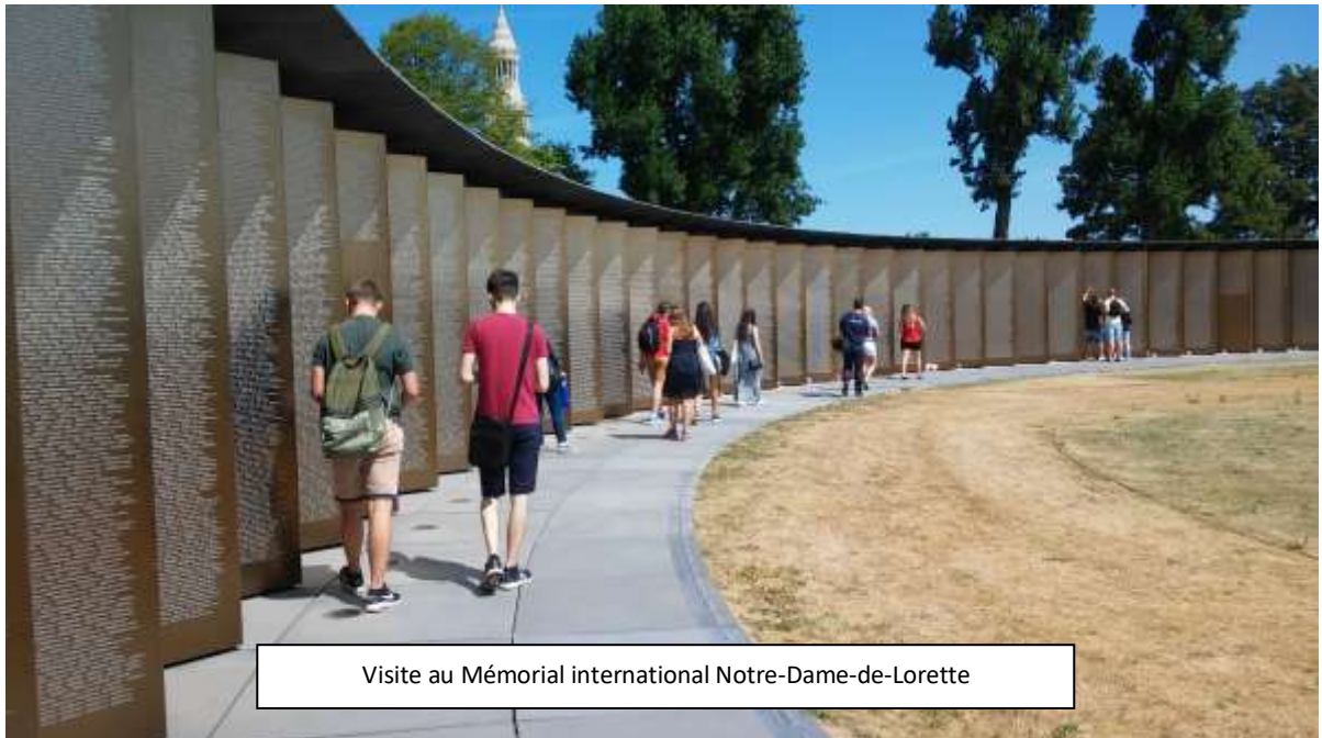
Visite au Mémorial international Notre-Dame-de-Lorette

Cette rencontre a été organisée avec la coopération et le soutien de la Région Hauts-de-France, Internationales Bildungs- und Begegnungswerk in Dortmund - IBB et la maison de la coopération germano-polonaise.