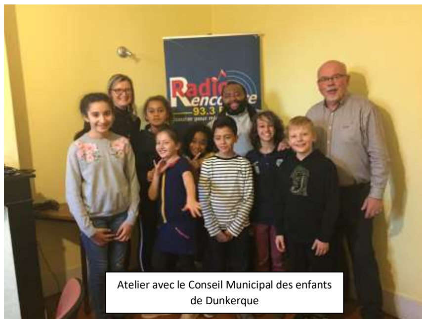
Atelier avec le Conseil Municipal des enfants de Dunkerque

Au total nous avons organisé 13 ateliers, avec 113 participants.