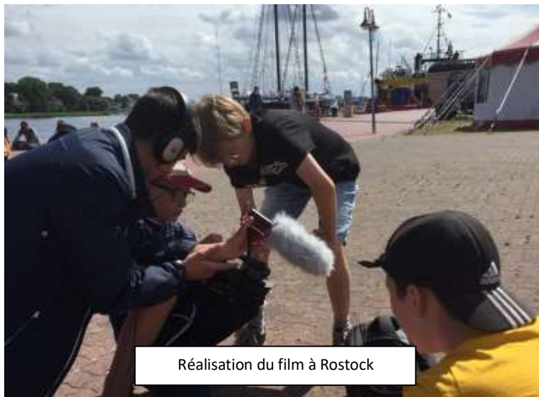
Réalisation du film à Rostock

Le voyage était la suite d'une rencontre de jeunes organisée par le Cefir et Arbeit und Leben à Dunkerque en 2017 autour de la radio. Cette fois-ci, les jeunes ont pu découvrir le support médiatique du film ainsi que la ville de Rostock et son patrimoine, le tout en étant hébergé dans un cirque ! Les échanges entre les jeunes allemands et français ont été favorisés par l'accompagnement d'une animatrice interculturelle certifiée par l'Office franco-allemand pour la Jeunesse.