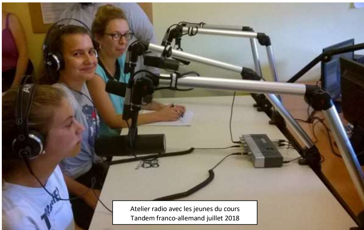
Atelier radio avec les jeunes du cours Tandem franco-allemand juillet 2018